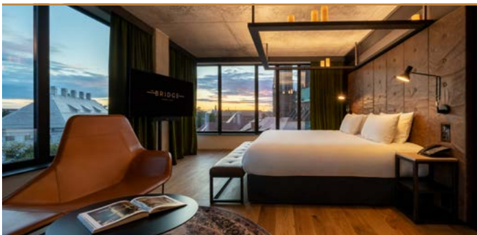
1. Apartament Prezydencki (90 m2)