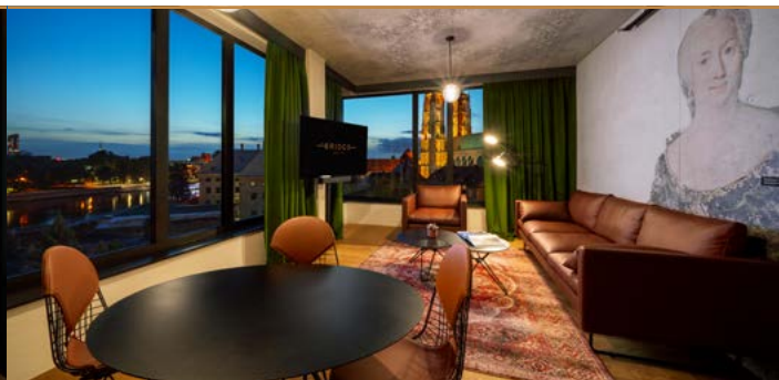
2. Apartament Premierowski (70 m2)